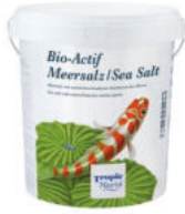
Tropic Marin® Bio-Actif Sea Salt