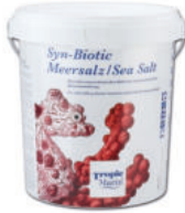
Tropic Marin® Syn-Biotic Sea Salt